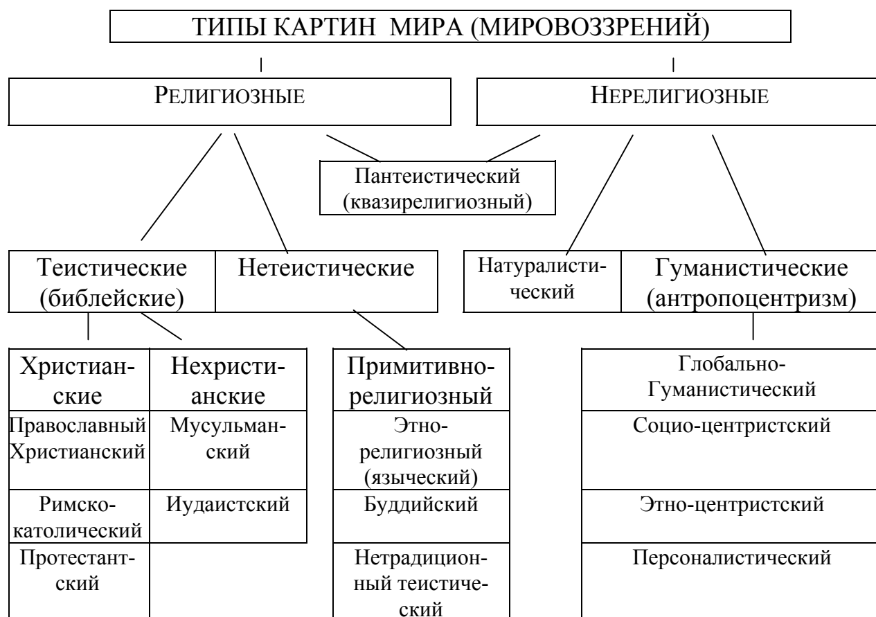
Схема №3 “Основные типы мировоззрений (картины мира)”.

В качестве средства условно-графической наглядности используется схема: