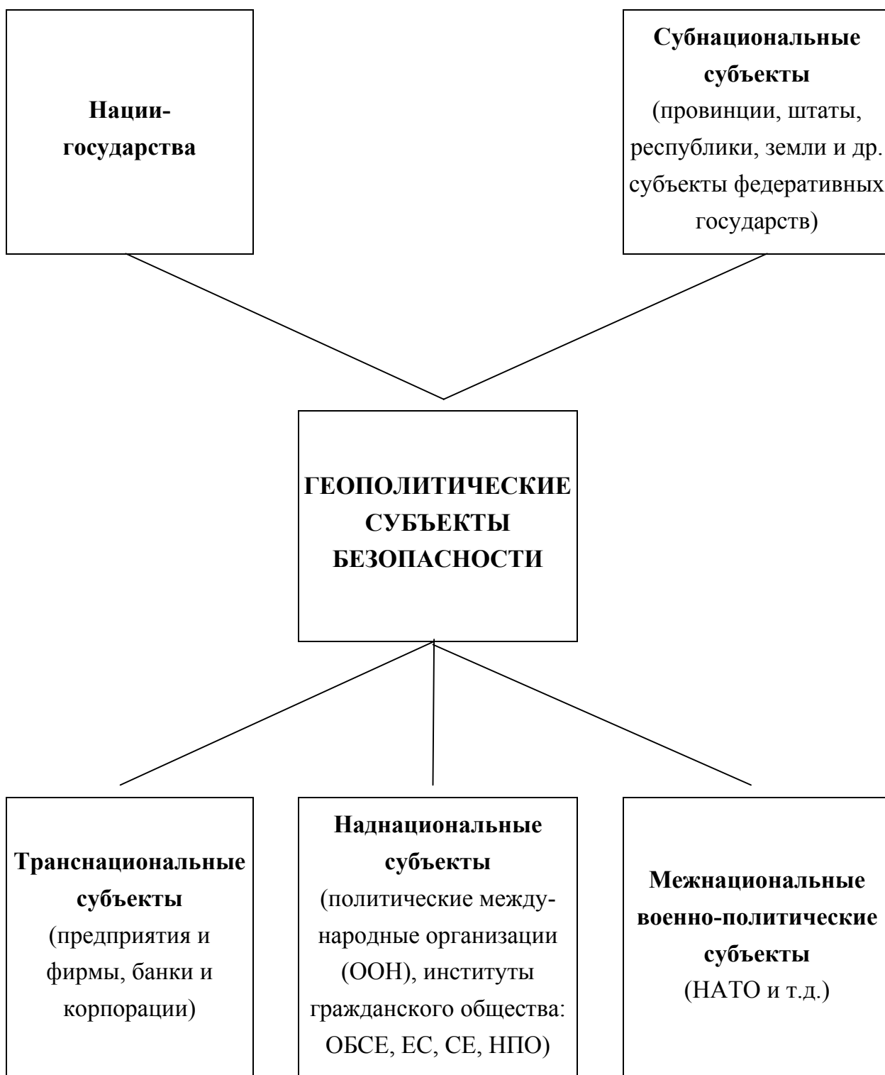
Рис. 3. Геополитические субъекты безопасности

Таким образом, международная безопасность – состояние отношений между государствами, характеризующееся их сотрудничеством в целях поддержания мира, предотвращения и устранения военной опасности, ограждения государств и народов от любых других посягательств на существование, независимое развитие и суверенитет.