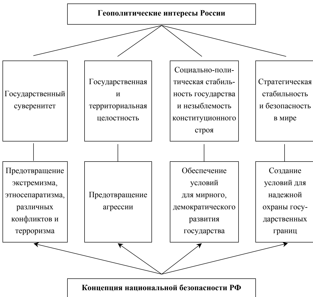
Рис. 5. Геополитические интересы России

В итоге «холодной войны» в мире произошло существенное изменение соотношения сил, установился принципиально новый миропорядок. Оказался разрушенным двухполюсный мир. Социалистический центр силы сошел с исторической арены. Ушла в прошлое система социализма и ее военная организация. Распался на отдельные государства Советский Союз. В мире остался один центр - Запад во главе с США. Мировой порядок стал однополюсным. Насколько длительным и устойчивым окажется однополюсный мир? В отечественной и зарубежной литературе одной из распространенных стала точка зрения, согласно которой однополюсный мир