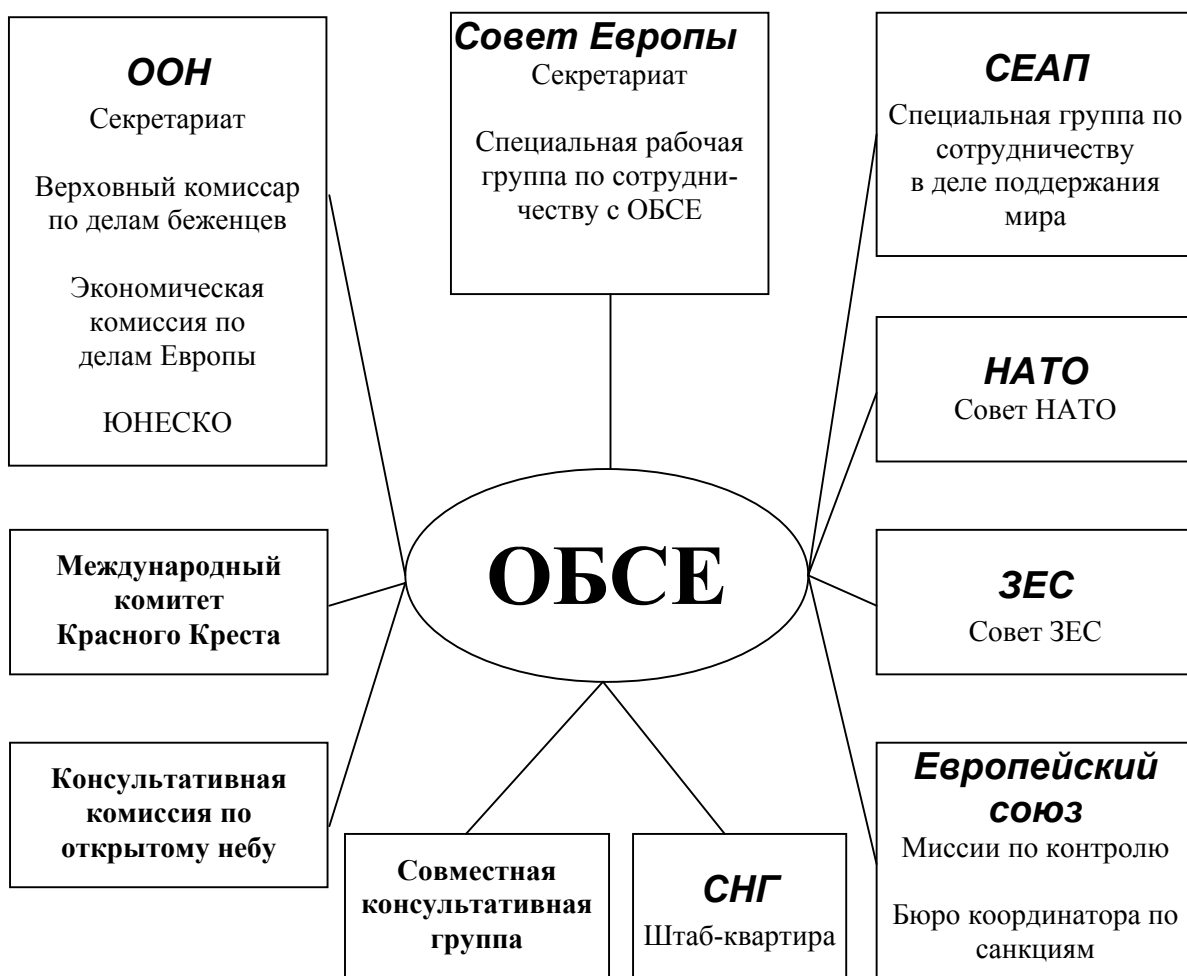
Рис. 4. Взаимодействие ОБСЕ с другими международными организациями и институтами

Саммит ОБСЕ в Стамбуле в 1999 году принял Хартию европейской безопасности. В документе вновь подтверждены все принципы ОБСЕ, ее предыдущие решения по созданию безопасности в зоне действия ОБСЕ.